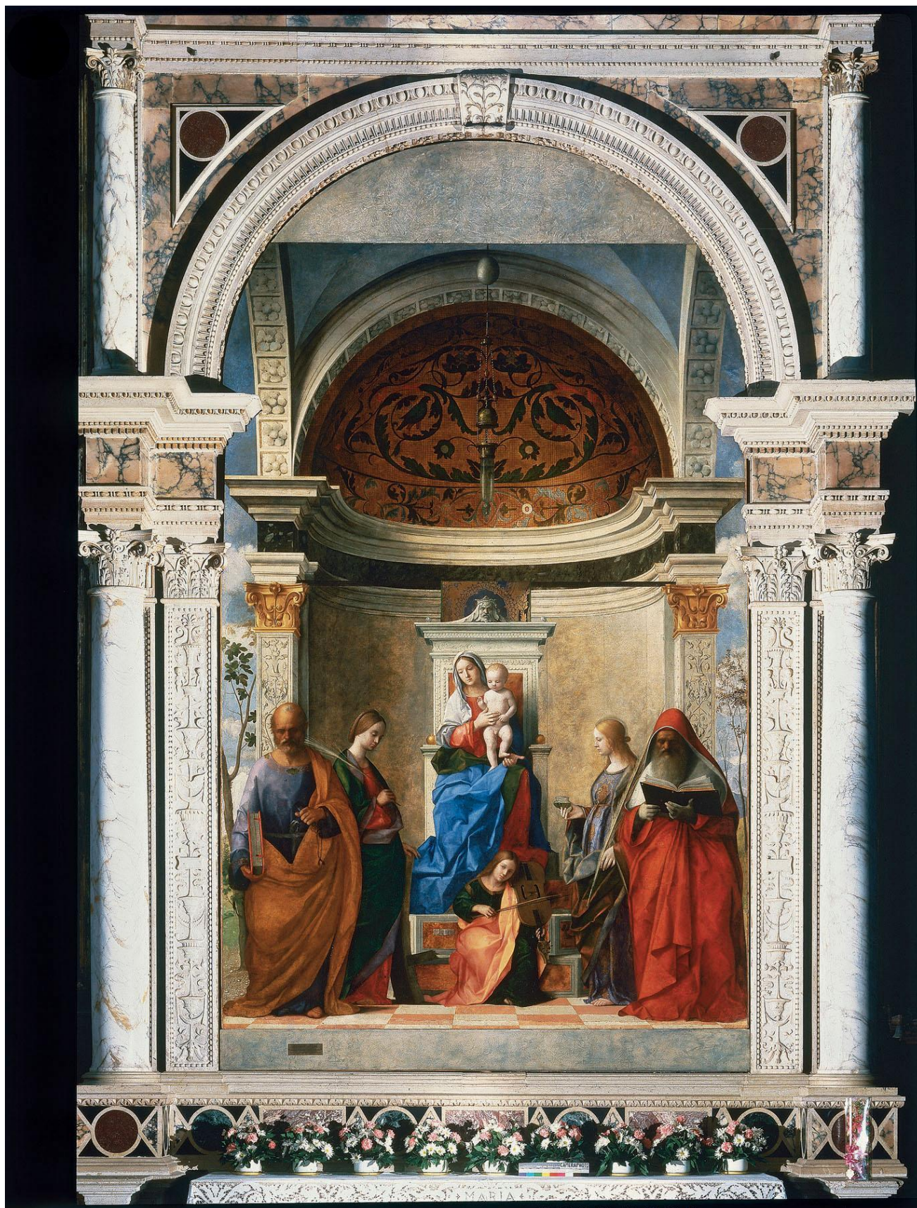
Джованни Беллини. Мадонна Сан-Дзаккария. 1505.