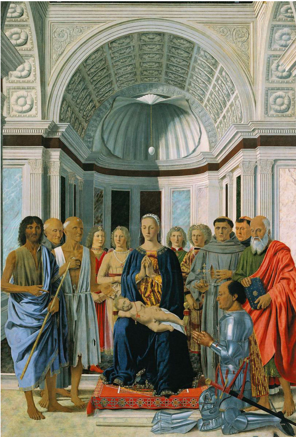
Пьеро делла Франческа. Алтарь Монтефельтро. 1472-1474.

С.1. Перед вами две картины на схожий сюжет: Мадонна с младенцем в окружении святых. Проанализируйте сходство и различия этих произведений. Порассуждайте о живописном языке эпохи Ренессанса.